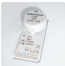
Pojemnik z soczewkami